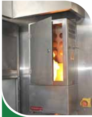
Feu d'armoire électrique