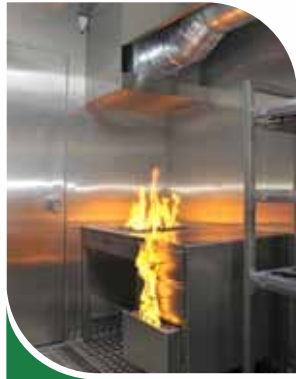
Feu de bureau