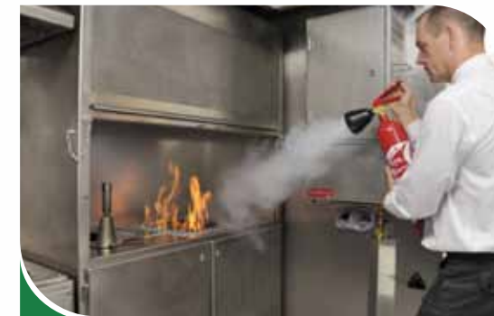
Feu de laboratoire