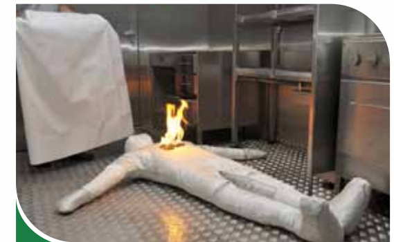
Feu de personne