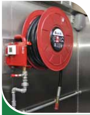
Robinet d'incendie armé