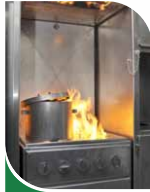
Feu de cuisine