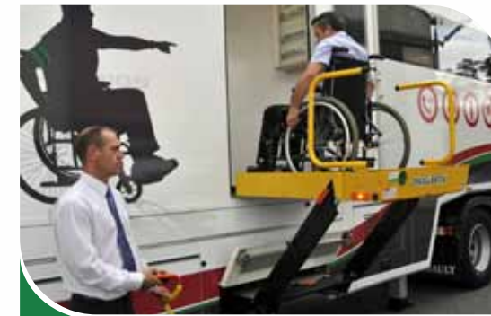
Accessibilité aux Personnes à Mobilité Réduite