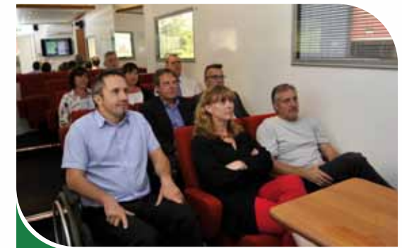
Salle de formation de haut standing