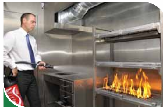
Feu de stockage