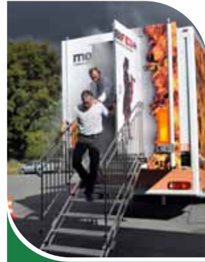
Evacuation d'une zone enfumée